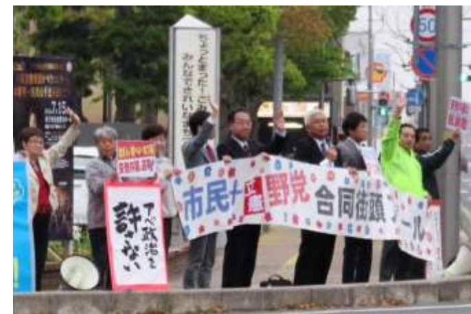
市民+立憲野党合同街頭アピール(4・23)