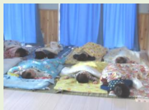
安心の保育をめざして

米子市の待機児童対策は民間丸投げ。安上がり保育による質低下が懸念されます。市内19カ所の小規模施設を訪問し、実態をつかみ議会でもとりました。