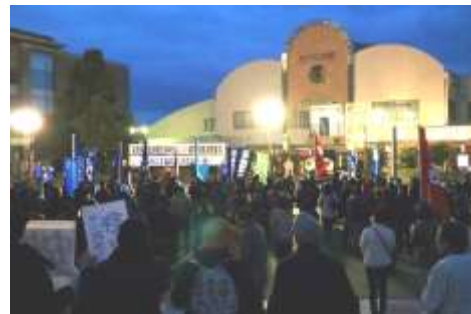
安倍退陣を求め4野党で緊急集会(3・20)

モリ・カケ疑惑、イラク日報隠し、セクハラ居直り…。安倍政権の退陣と新しい政権づくりを、市民と野党の共闘ですすすめます。