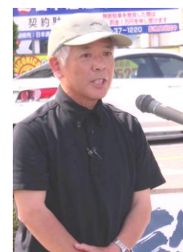
いつも市民の運動とともに

1952年生まれ。広島大学卒。鳥取富士書店、新日本海新聞社に勤務。日本海新聞労組や保育園保護者会の役員を歴任。95年から米子市議会議員(6期)。