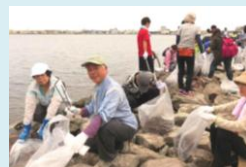
中海一斉清掃に参加

産廃、中海、原発、基地、場外馬券売場など市政の大問題で、住民運動にかかわってくるとともに、超党派のとり組みへ努力しました。